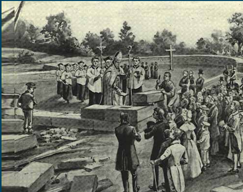
El arzobispo Carroll, colocando la primera piedra de la Basílica de la Santísima Virgen María, en Baltimore, la primera catedral católica de los Estados Unidos.